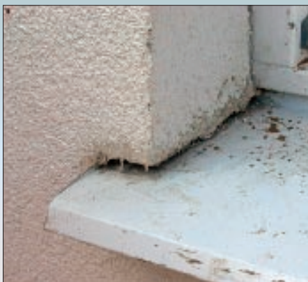
Отслоения, растрескивания и разрушения армирующего и декоративного слоев в местах примыкания к отливу появились из-за неправильно организованного деформационного шва