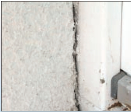
Отслоения, растрескивания, разрушения армирующего и декоративного слоев в местах примыкания к оконным проемам образовались из-за неправильно организованного деформационного шва