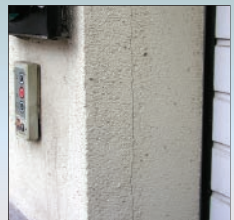
Примыкание теплоизоляционных плит к кирпичной кладке, выполненное без деформационного шва, привело к появлению трещин