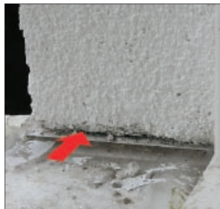
Установка отливов произведена жестко, без формирования необходимого деформационного шва. Отливы установлены с зазором и дают возможность проникновения воды вглубь теплоизоляционной плиты