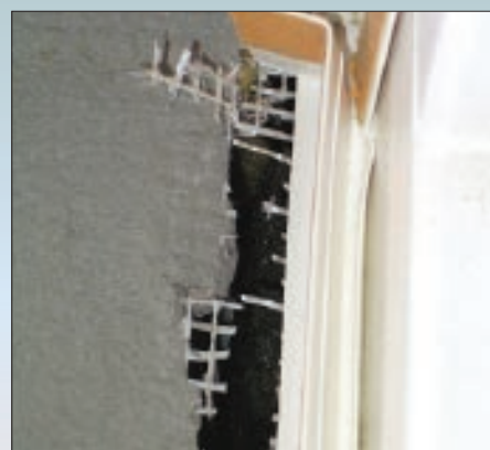
Деформационный профиль установлен с перекосом. Стеклотканевая сетка не заведена в полочку профиля. Зазор не заполнен теплоизоляционным материалом