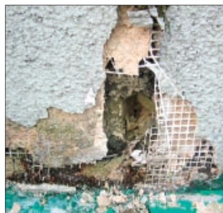
Примыкание системы теплоизоляции к цокольной части здания выполнено жестко, без учета возможных расширений и деформаций, без использования деформационных материалов

Профили примыкания различаются по своим размерам, местам применения и эксплуатационным характеристикам. Профили применяются для создания плотных деформационных швов в местах соединения с различными строительными элементами, имеют специальный самоклеящийся уплотнитель, который позволяет создать надежное примыкание и предохраняет от проникновения влаги и ультрафиолетовых лучей. Профили предотвращают штукатурный слой от растрескивания в местах примыкания и создают устойчивый к старению, четкий и ровный шов. Большинство профилей имеет отламывающуюся защитную планку с клеевым слоем, на который при производстве работ наклеивается защитная пленка, предохраняющая строительные элементы от загрязнения при нанесении армирующих материалов. После окончания работ планка удаляется.