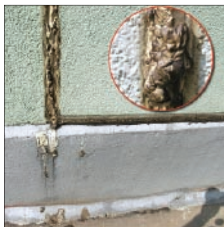
Применение несоответствующих по типу и эксплуатационным характеристикам герметизирующих материалов в деформационных швах

Полиуретановые герметики наиболее прочные, с высокой долей эластичности и наиболее долговечные из всех видов герметизирующих материалов. Они представляют собой готовую к применению однокомпонентную вязкую массу, состоят из полиуретановых полимеров и не содержат растворителей. При непосредственном контакте с влагой воздуха герметик отверждается в течение нескольких часов. Основные типы полиуретановых герметиков не подвержены усадке.